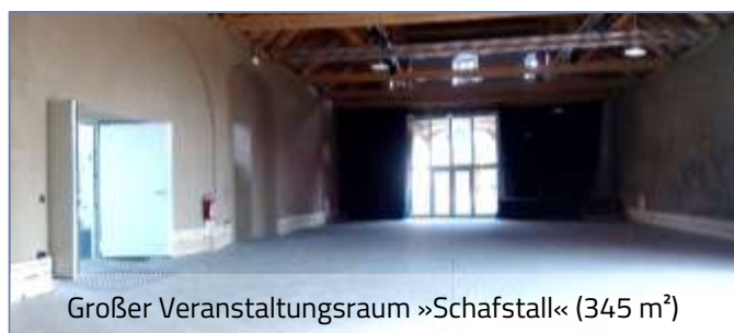
Großer Veranstaltungsraum »Schafstall« (345 m 2 )