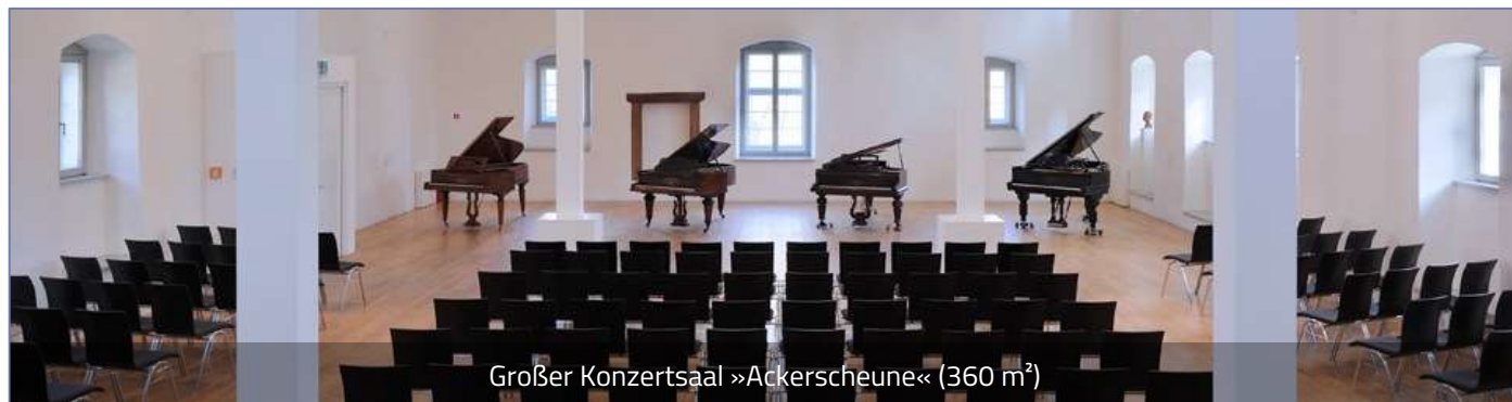
Großer Konzertsaal »Ackerscheune« (360 m 2 )

Die Preise verstehen sich als Miete für genutzte Räumlichkeiten incl. Bestuhlung und Tische (Mengenangaben siehe Detailinformationen zu den einzelnen Räumlichkeiten) zzgl. Nebenkosten. Der Mehrbedarf an Möblierung sowie Sonderwünsche werden, soweit erfüllbar, separat berechnet. Ebenfalls nicht in den Mietpreisen enthalten sind Kosten für Flügelnutzung, Podeste, Dekorationen ..., soweit diese gewünscht sind. Einzelheiten können auf Anfrage geklärt werden. Alle Preise verstehen sich zzgl. Umsatzsteuer.