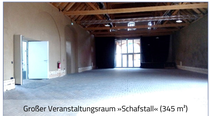
Großer Veranstaltungsraum »Schafstall« (345 m 2 )