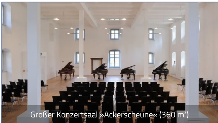
Großer Konzertsaal »Ackerscheune« (360 m 2 )

Die Kulturstiftung Marienmünster verfügt über drei Gebäude, die zu einer ehemaligen Klosteranlage gehören und z. T. bis in die 1990er Jahre für landwirtschaftliche Zwecke genutzt wurden. Um sie vor dem Verfall zu bewahren, hat die Eigentümerin der Gebäude, die Derenthal'sche Stiftung, die Gebäude restauriert, ab Anfang der 2000er Jahre sukzessive zu Veranstaltungsräumen ausgebaut und sie der 2007 von ihr gegründeten Kulturstiftung übergeben. Die drei Gebäude unterscheiden sich in Größe und Ausstattung: Die ehem. Ackerscheune (360 m 2 ) wurde mit Hilfe eines Akustikexperten zu einem Konzertsaal hergerichtet, in dem regelmäßig hochwertige klassische Tonaufnahmen erstellt werden. Das Mittelgebäude (ehem. Reisescheune, 190 m 2 ) mit seinem Gefache und einer zweiten Ebene dient gern als Foyer oder für kleinere Veranstaltungen, kann aber auch je nach akustischem Anspruch als Aufnahmerraum genutzt werden. Im ehem. Schafstall (345 m 2 ) mit seiner rustikalen Ausstattung finden häufig Theater- und ähnliche Aufführungen sowie private Feiern statt. Auch dieser Raum eignet sich je nach Anspruch für Tonaufnahmen.